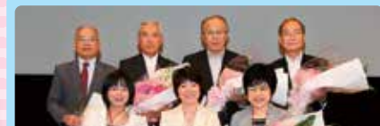
退任される理事や監事のの方々