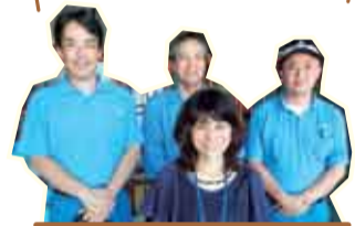
▲セットセンター責任者の皆さん