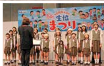
香川オーブ少年少女合唱団