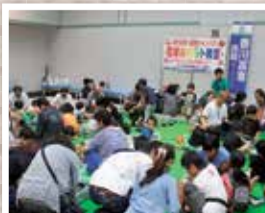
子供簡単ロボット教室 (ご協力:香川高専読間キャンパス)