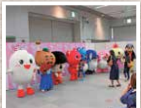
キャラクターとの写真撮影会