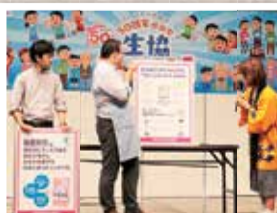
お取引先様のPRタイム