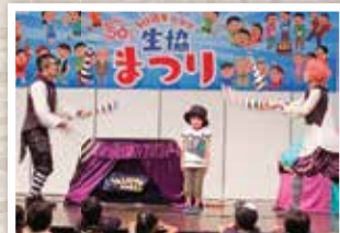
ちいさなサーカス団 talatta latta