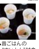
▲昔ごはんの「すいとん」試食