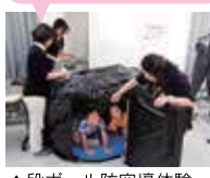
▲段ボール防空壕体験