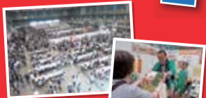
▲昨年の「生協まつり」の様子

120を超える生産者、メーカーが出展!お買い得品、掘り出し品が満載です。ご家族お揃いでご来場ください!