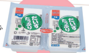
だいたつぷりとうふ