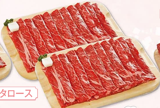
牛モモしゃぶしゃぶ