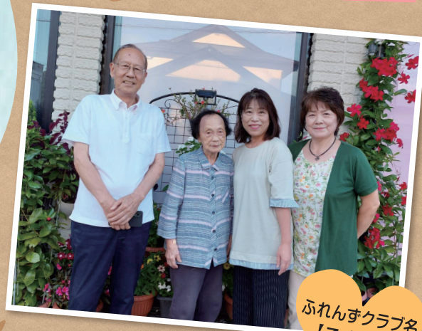
ふれんずクラブ名 【こずりん】