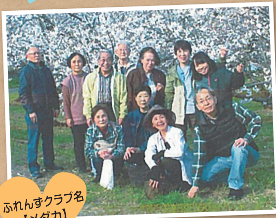
ふれんずクラブ名 【メダカ】