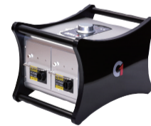
空家の消臭・除菌 オゾン発生器で お部屋の消臭と除菌を 行えます。