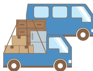
軽貨物でのお引越し (軽自動車運搬)