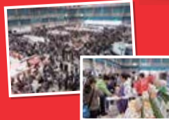
▲昨年の「生協まつり」の様子

おかげさまで今年、創立50周年を迎えることができました! 「ありがとう」の気持ちを込めて、おなじみの商品の展示即売会&試食会を行います。