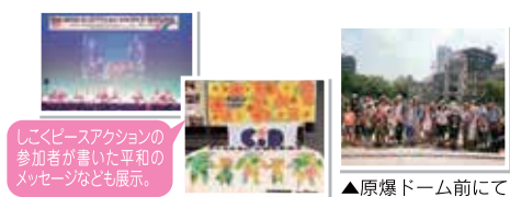
しこくピースアクションの参加者が書いた平和のメッセージなども展示。 ▲原爆ドーム前にて

◆8月5日(金) 香川から参加した、親子8組27名が平和記念資料館などを見学し、日本生協連主催の平和イベント「せいぎょう虹のひろば」に参加しました。