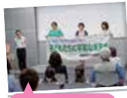
今年は徳島から香川へ引き継がれた横断幕を高知へ

「子どもたちに平和な未来を」をスローガンに、四国四県の生協で思いの詰まった横断幕を繋ぎ、広島へ届けます。戦争の悲惨さ、平和の尊さを確認し合う1日となりました。